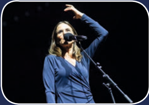
Mixed Show: Kunst gegen Bares