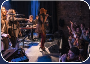
Frische Mucke: POP!Stage