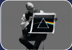
Kino: Squaring the Circle

Rolandsmauer 26 49074 Osnabrück www.lagerhalle-os.de mail: info@lagerhalle-os.de fon: 0541-33874-0 fax: 0541-33874-50