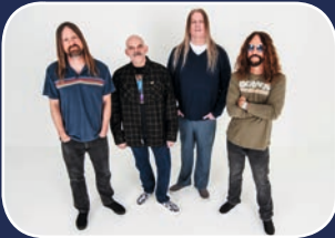
Stoner Rock: Fu Manchu